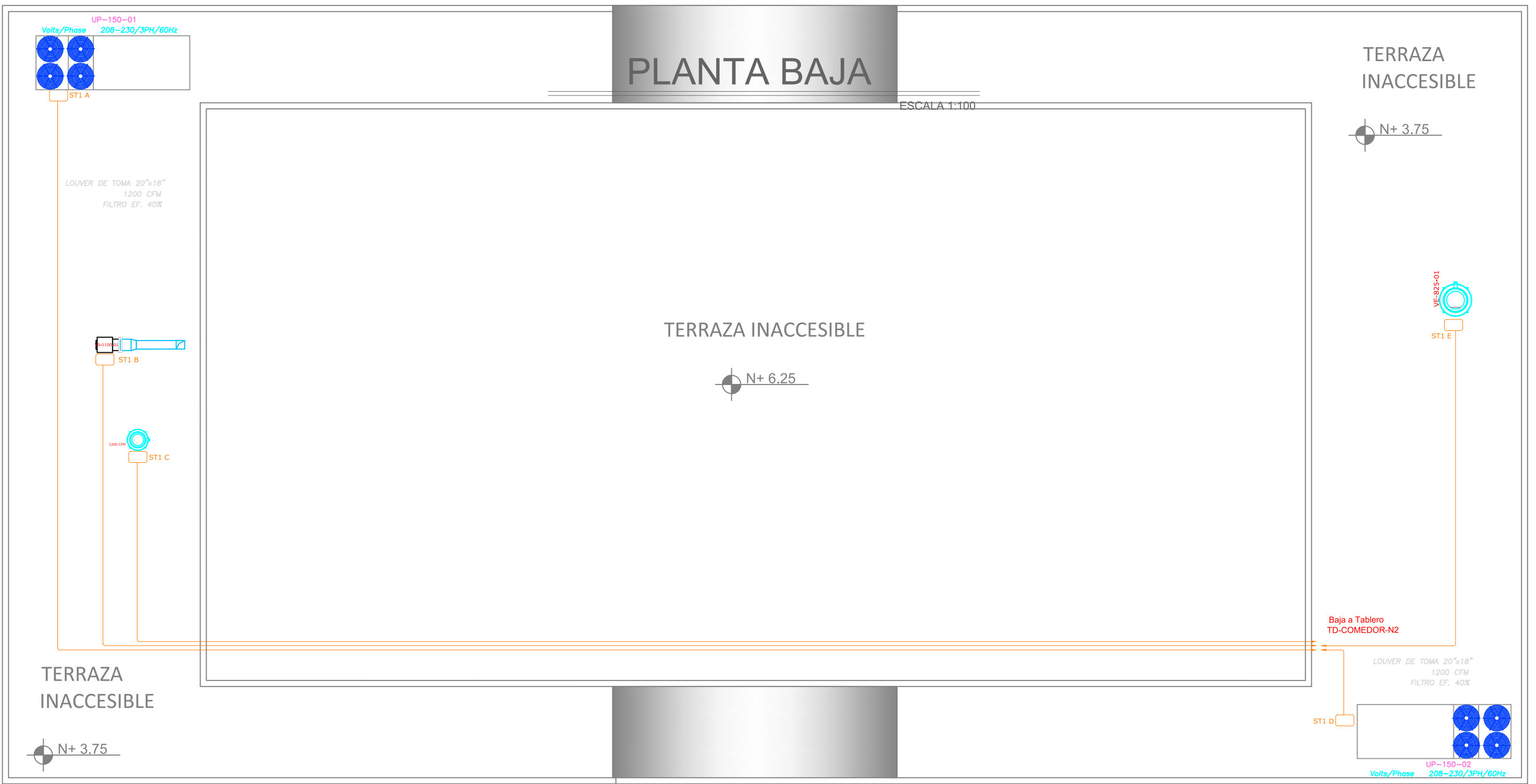
PLANTA DE CUBIERTA ESCALA 1:100